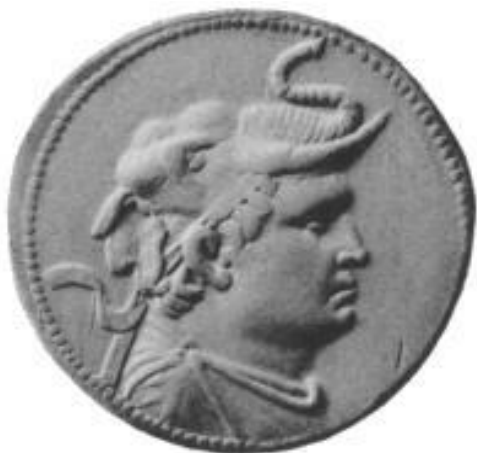
Сребрњак са ликом Деметрија I Полиоркета Бактријског

Полиоркета. У међувремену је у Малој Азији оформљено ново краљевство са центром у граду Пергаму. Убрзо је Селеукова држава подељена на низ мањих и одвојених државица које су предводили локални владари. Тако су настале Битинија, Јерменија, Понт, Кападокија и друге.